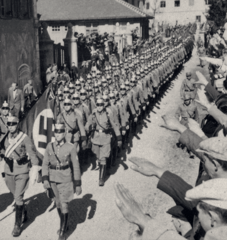
Einmarsch der deutschen Polizei in Imst, 1938

Im Frühjahr 2026 erscheint das Buch „Wahre Volksgemeinschaft“ Nationalsozialismus in Imst.