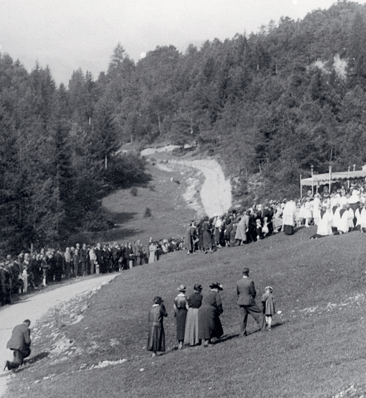
Maria Himmelfahrtsprozession außerhalb des Stadtgebietes

Auch die katholische Kirche wurde aus dem öffentlichen Leben zurückgedrängt, Prozessionen verlegt, Kreuze zerstört und Brunnenfiguren entfernt.