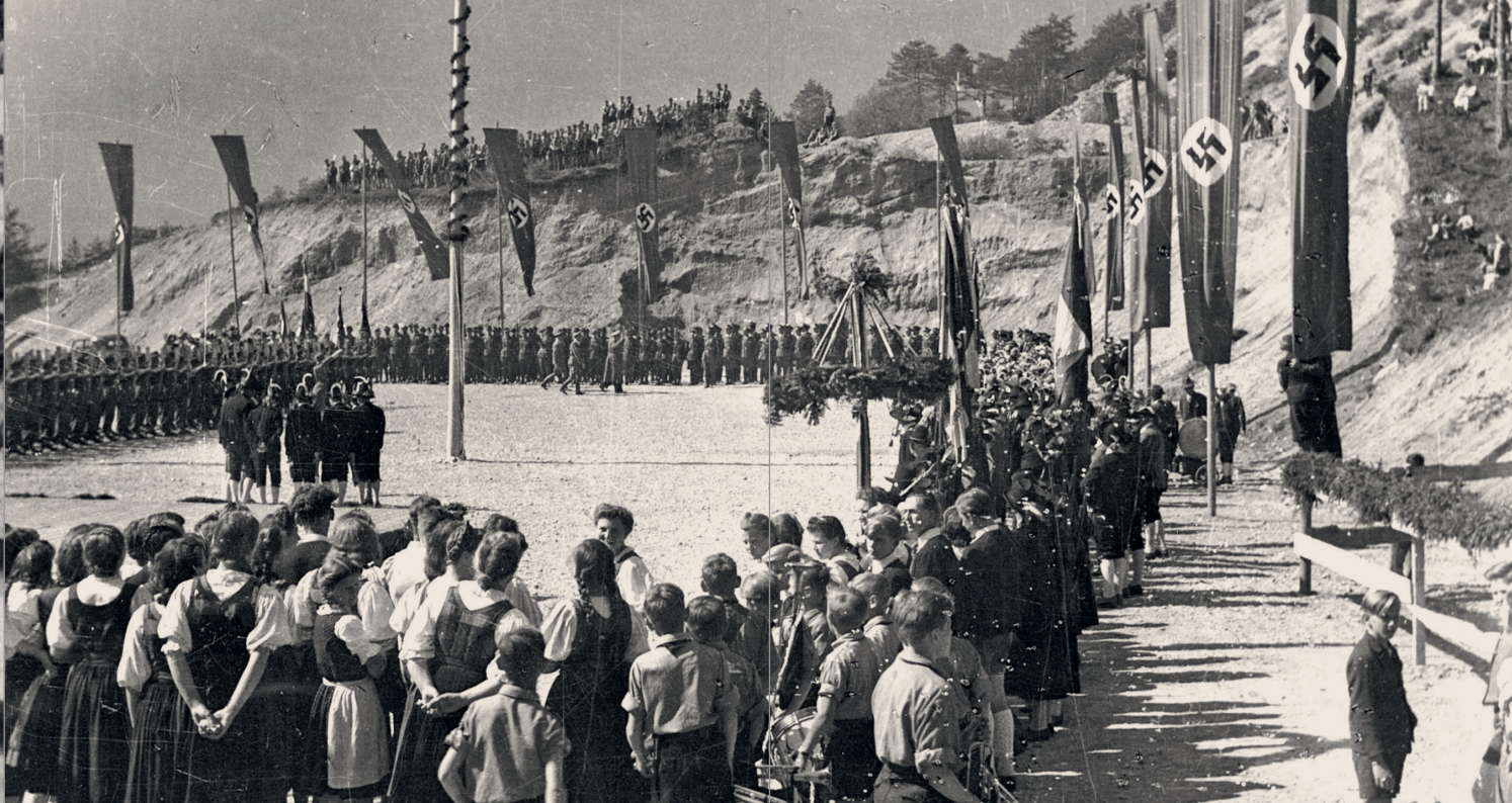
Feierlichkeiten am neu eröffneten Imster Schießstand, ca. 1943

Eine Ausstellung im Museum im Ballhaus veranschaulicht anhand zahlreicher Fotos, Plakate, Flugzettel und filmischer Dokumente die Zeit des Nationalsozialismus in Imst.